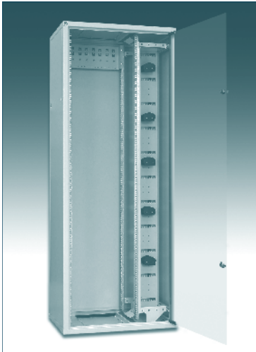
Szafa przełącznic światłowodowych OptiTel SPS N 19/45U/800